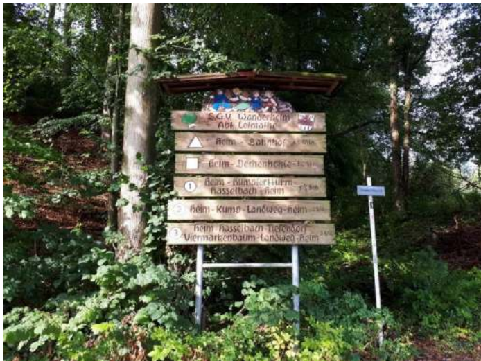
Historische Tafel mit Hinweisen auf SGV-Wanderwege in Letmathe

Sauerländischer Gebirgsverein Abteilung Letmathe e. V.