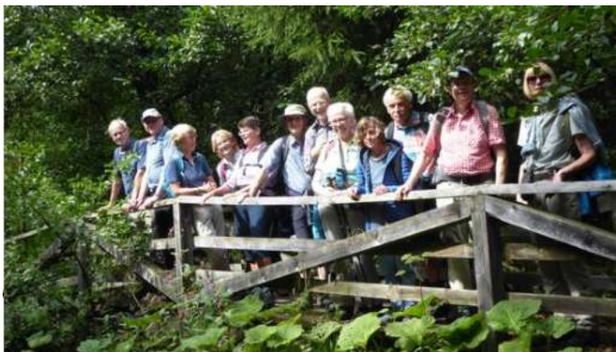
Auf dem Klosterweg von der Abtei Königsmünster zum Bergkloster Bestwig