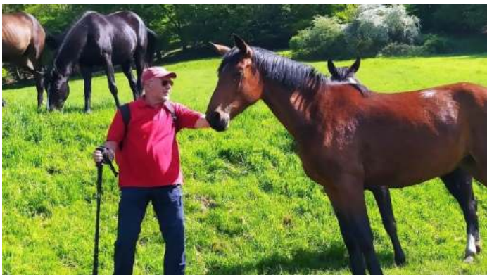
Der Weg über die Pferdekoppel bei Nachrodt