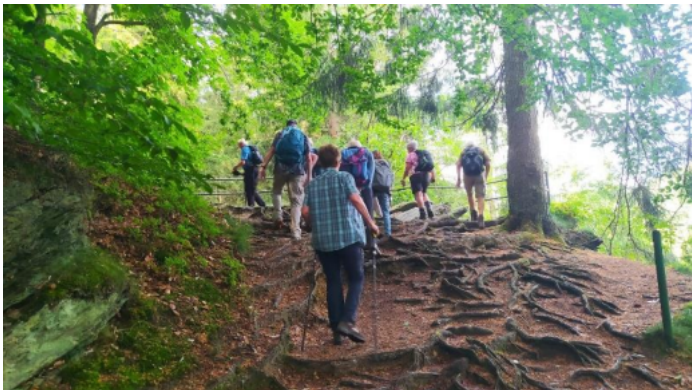
Im Nationalpark Eifel