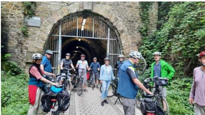
Radtour von „Ruhr zur Ruhr“