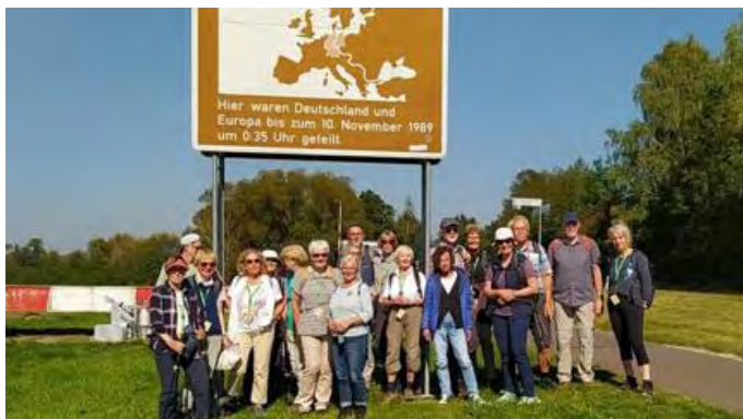
Wanderreise „Sagenhaft Grenzenlos“: Rundtour Grenzlandmuseum Eichsfeld