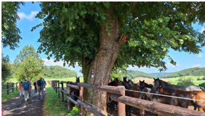
Auf dem Weg zum Kloster Oelinghausen