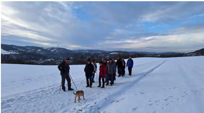
Durch die Winterlandschaft geht's zum SGV-Grünkohlessen