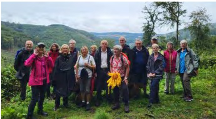
Fotostopp anlässlich der Wanderung „Über den Wolken von Iserlohn“