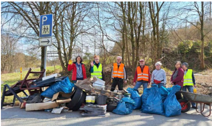
SGV-Umweltaktion: Und erneut hat sich die Mühe gelohnt!