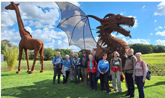
Das Muttental, die Bergbaugeschichte und die gewaltigen Kunstobjekte