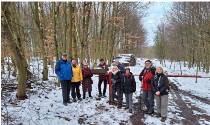
Neues Jahr, neues Glück: Auf dem Letmather Wanderweg A3