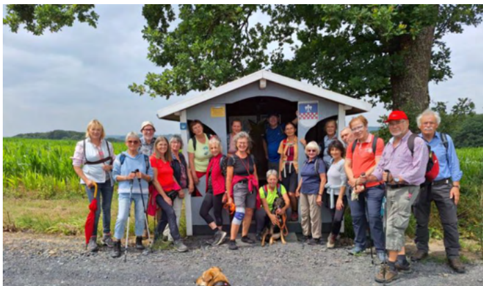
Sommerwanderung am Mäckingerbachtal